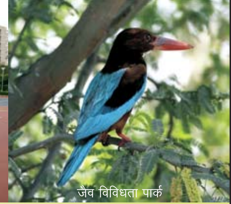
जैव विविधता पार्क

एशिया का सबसे बड़ा और विशाल शहरी विकास प्राधिकरण पिछले 54 वर्षों में विकास का सबसे भरोसेमंद नाम