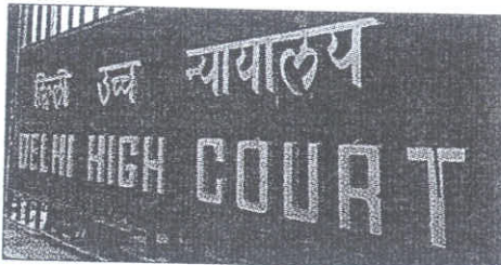
वरिष्ठ संवाददाता ॥ हाई कोर्ट