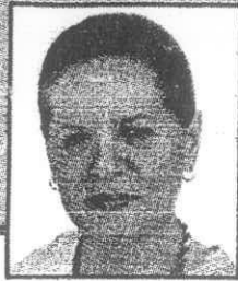
श्रीमती सोनिया गांधी माननीया अध्यक्ष, यूपीए