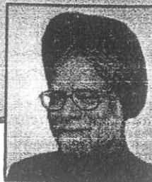
डॉ. मनमोहन सिंह माननीय प्रधानमंत्री