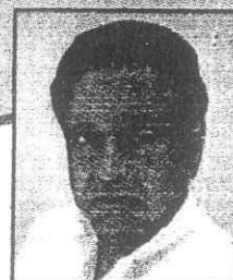
श्री कमल नाथ माननीय शहरी विकास मंत्री