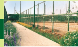
Netaji Subhas Sports Complex

The colony is fully developed with all infrastructural facilities such as roads, water supply, sewerage, power supply etc. The area is well connected with the prime locations of Delhi. DDA Colony, Sarita Vihar is just opposite to this prime location. It is also adjacent to Netaji Subhash Sports Complex, DDA. Expressway to Noida and Greater Noida is at a distance of 6 Km. from the proposed plots for auction.