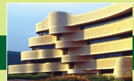
Rajiv Gandhi Cancer Hospital

The colony is adjacent to Pitampura having all infrastructural facilities with following added advantages:-