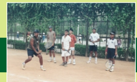
Major Dhyan Chand Sports Complex

This is a well established residential and commercial locality that can boast of all the civic amenities. Being a vibrant part of north-west Delhi, Ashok Vihar offers some of the finest residential features which includes DDA Sports Complex. There are many new facilities coming up in the area that will make the locality a promising deal for new property investors.