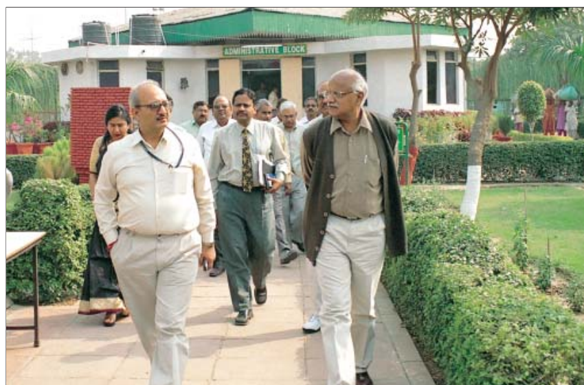
चिल्ला खेल परिसर का दौरा करते हुए अभियन्ता सदस्य, दि.वि.प्रा.

आपत्तियां/सुझाव आमंत्रित करने के लिए जोन 'जे' के क्षेत्रीय विकास के मसौदे को प्राधिकरण ने 28.06.2006 को आयोजित अपनी बैठक में अनुमोदित किया। आपत्तियां/सुझाव आमंत्रित करने के लिए दिनांक 21.08.2006 को सार्वजनिक सूचना जारी की गई। जोन 'जे' के लिए प्राप्त आपत्तियों/सुझावों पर कार्यवाही के उद्देश्य से अभियन्ता सदस्य, दि.वि.प्रा. की