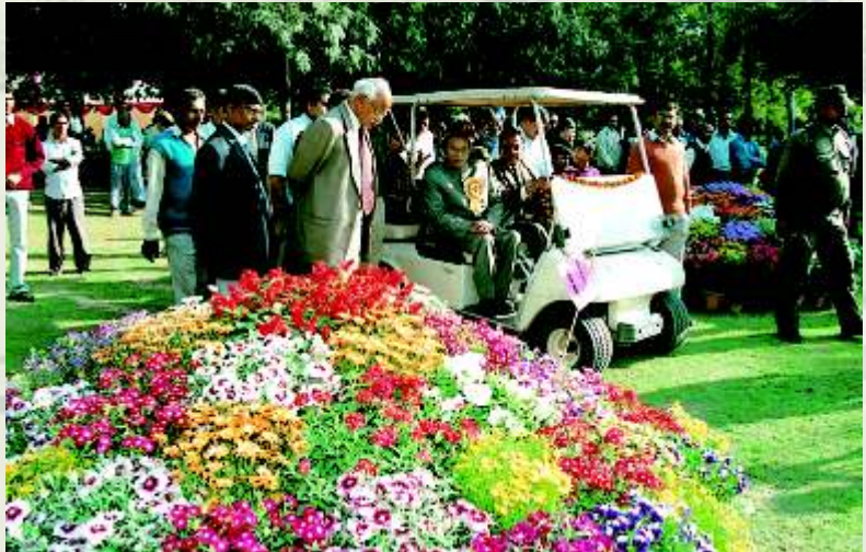
श्री ए. स. ज. यपालर 'डडीक 'न्द्रीय, र 'हरीर विकास मंत्री, जिलाप 'र्क, ह 'ोजर 'ासम 'दि. वि. प्रा. द्व 'राउ 'ा योजितपु, षप्र 'दर्शनीम '