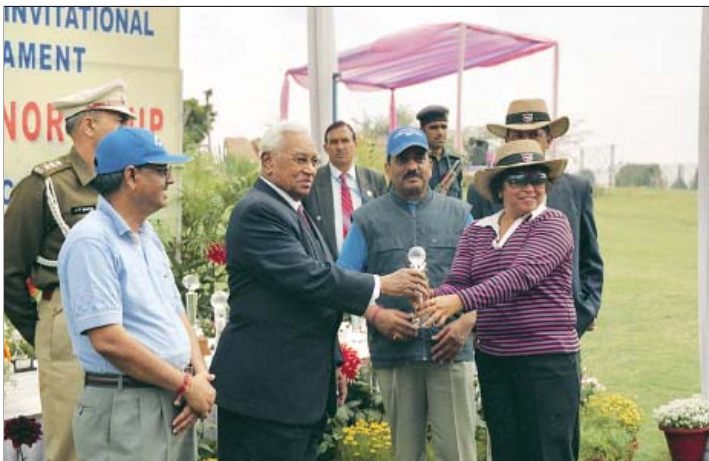
विजेता को ट्राफी प्रदान करते हुए दिल्ली के प्रशासक और हरियाणा के राज्यपाल डा. ए. आर. किदवई