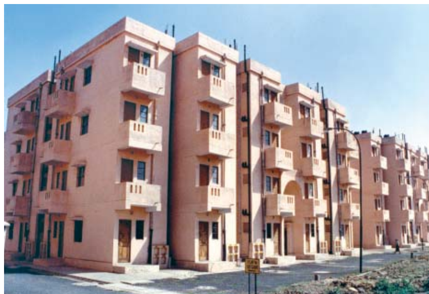
दि.वि.प्रा. जनता फ्लैट