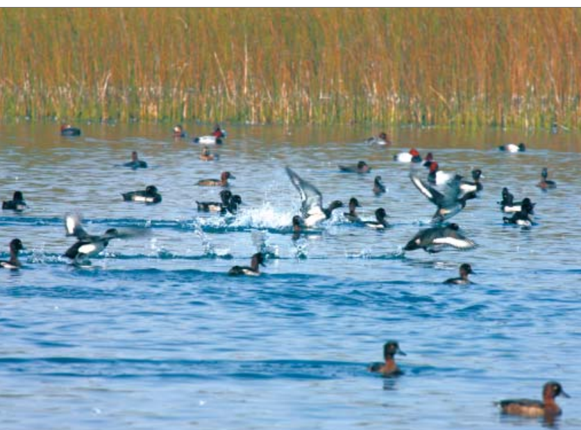
यमुना जैव-वैविध्य पार्क में प्रवासी पक्षी

वादी सोसाइटी को नर्सरी स्कूल चलाने के उद्देश्य से शाश्वत पट्टा दिनांक 12.4.90 के द्वारा 5,63,380/- रु. के प्रीमियम पर 800 वर्ग मीटर आकार का प्लॉट न. 1, सैक्टर-ए, पाकेट-बी, बसन्त कुंज, नई दिल्ली आबंटित किया गया था। दि.वि.प्रा. ने वहां गर्ल्स होस्टल और एच.पी. इन्स्टीट्यूट ऑफ वोकेशनल स्टडीज चलाने पर उसके दुरुपयोग का कारण बताओ नोटिस जारी किया। क्योंकि नोटिस का उत्तर संतोषजनक नहीं था, इसलिए 14.05.03 को पट्टे को रद्द कर दिया गया। वादी ने यह घोषणा चाहते