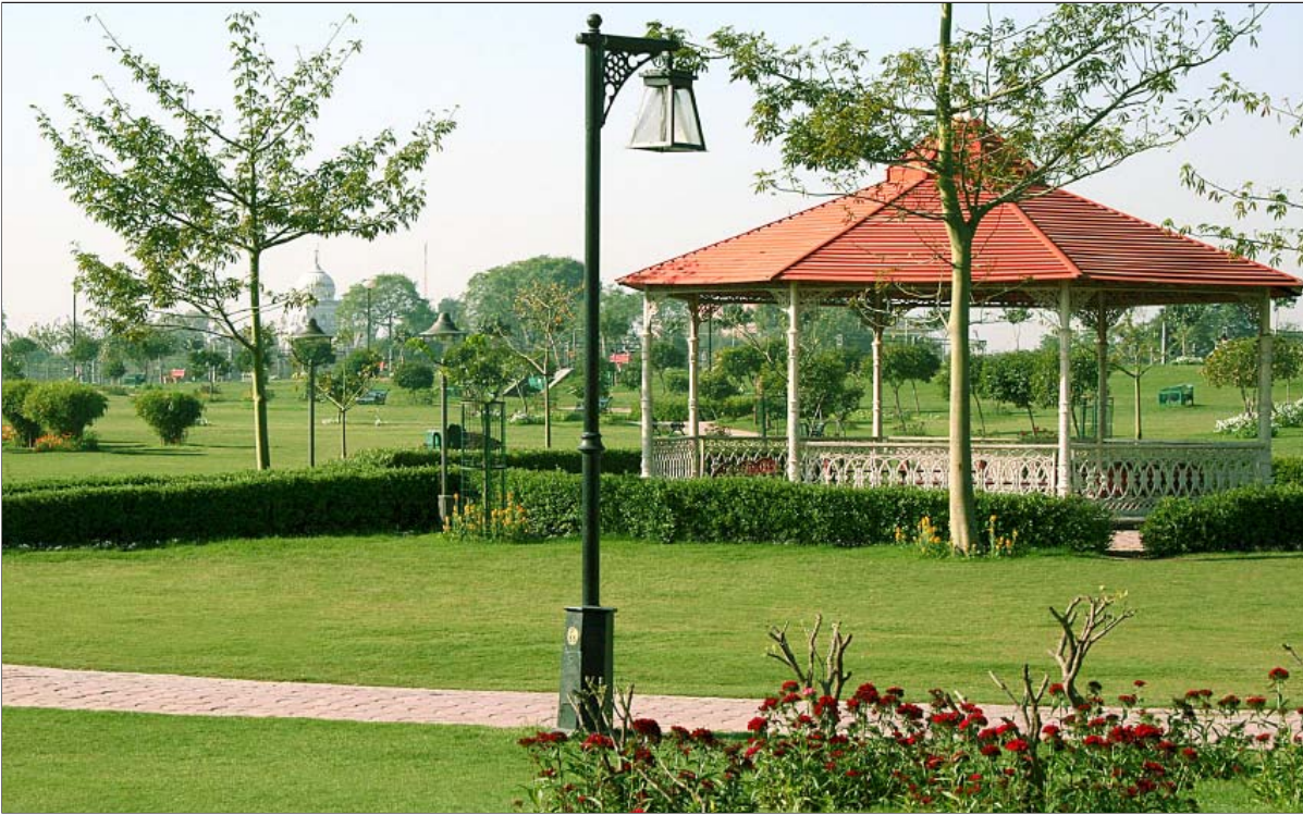
इंद्रप्रस्थ पार्क का एक दृश्य