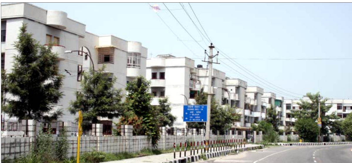
रोहिणी में दि.वि.प्रा. के फ्लैट

ii) आबंटन: वर्ष 2006-2007 के दौरान चल रही विभिन्न आवासीय योजनाओं के अंतर्गत 4085 फ्लैट आबंटित किए गए। 2201 पंजीकृत व्यक्ति आबंटन के लिए प्रतीक्षारत थे।