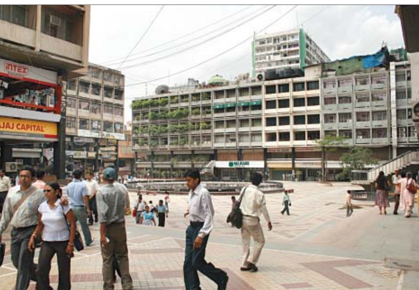
नेहरू प्लेस, जिला केन्द्र

सलाहकार के साथ करार बढ़ाने पर विचार किया जा रहा है।