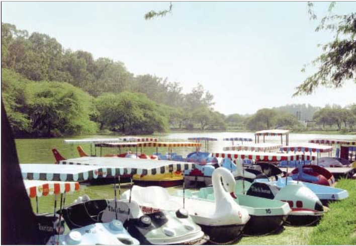
संजय झील परिसर