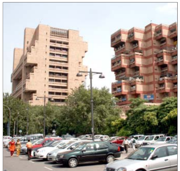
भीकाजी कामा प्लेस जिला केन्द्र