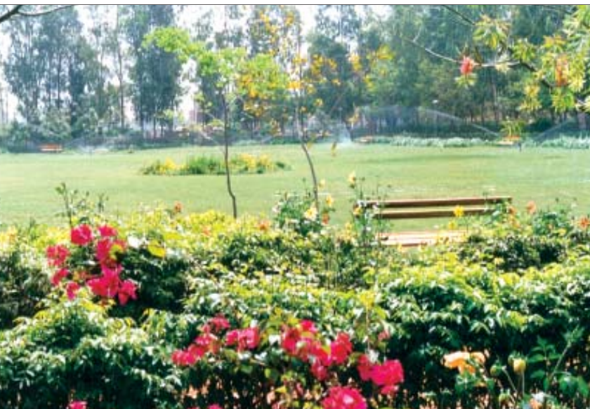
जिला पार्क, द्वारका

25000 से अधिक चूककर्ता आबंटितियों के विरुद्ध