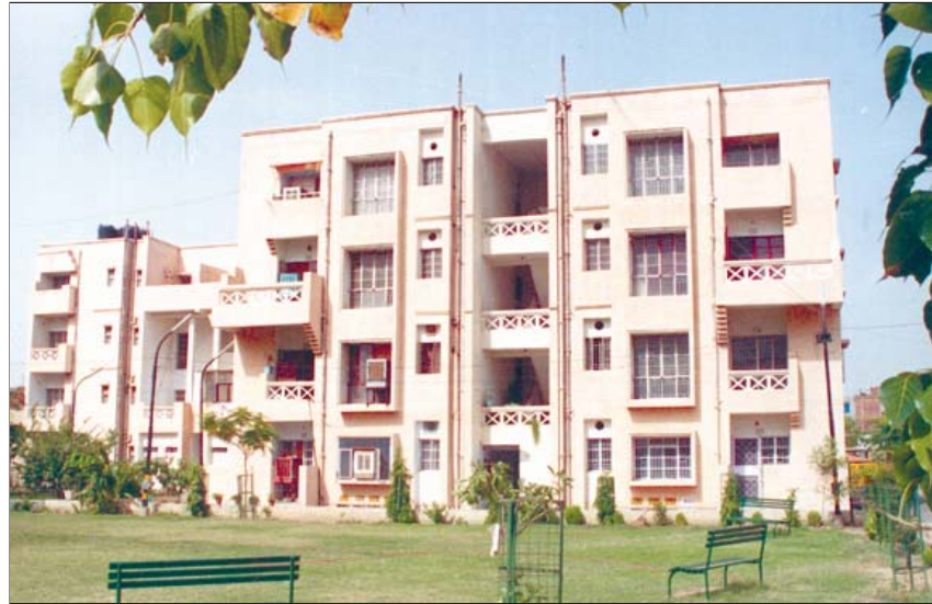
दि.वि.प्रा. के एच.आई.जी. फ्लैट

i) निर्माण-कार्य: चल रही विभिन्न योजनाओं के पंजीकृत व्यक्तियों की बकाया संख्या को निपटाने के लिए निर्माण-कार्यकलापों में तेजी लायी गयी। इस वित्तीय वर्ष के आरंभ में 11124 आवासों का निर्माण-कार्य