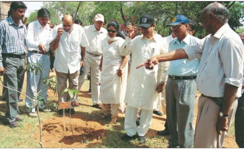
अरावली जैव-वैविध्य पार्क में केन्द्रीय शहरी विकास राज्य मंत्री, श्री अजय माकन