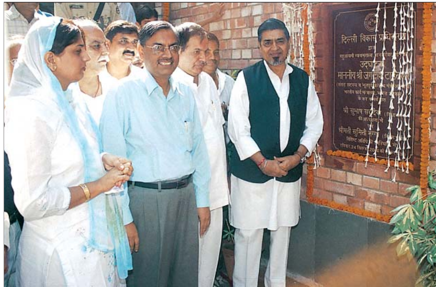
श्री जगदीश टाइटलर, सांसद मानसरोवर गार्डन में बहु व्यायामशाला का उद्घाटन करते हुए।

एक वर्ष की अवधि के अन्दर पूरी किए जाने की संभावना है।