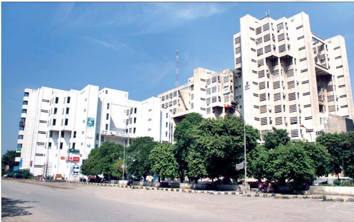
जनकपुरी जिला केन्द्र