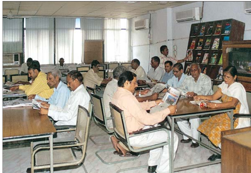
विकास सदन में पुस्तकालय का एक दृश्य

आर एंड जी मोड्यूल के माध्यम से सभी प्राप्तियों और प्रेषणों को संभाला जाता है। इससे विभिन्न विभागों में फाइलों की मोनिटरिंग स्थिति में सहायता मिलती है। आर.टी.आई. अधिनियम के अनुसार सूचना पाने के लिए जनता के अनुरोध की फीडिंग को भी आर.एंड.जी प्रणाली में शामिल किया गया है।