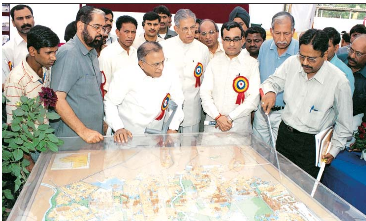
श्री एस. जयपाल रेड्डी, केन्द्रीय शहरी विकास मंत्री को द्वारका के फ्लाईओवर के माडल की जानकारी देते हुए

5.7 8 (आठ) मामलों में अभियोजन संस्वीकृति प्रदान की गई जिसमें 13 कर्मचारियों के विरुद्ध आपराधिक कार्यवाही चलाने के लिए संस्वीकृति प्रदान की गई।