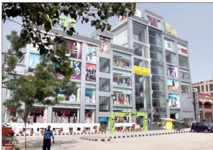
सुभाष नगर जिला केन्द्र

ख) तीनों खातों की वित्तीय स्थिति निम्नलिखित पैरों में संक्षिप्त रूप से दी गई है: