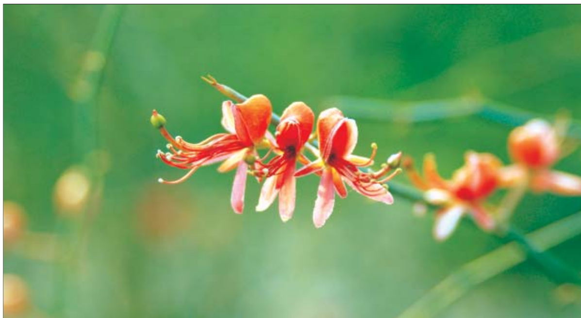
यमुना जैव-वैविध्य पार्क में कैपारिस डेसिडुआ की एक दुर्लभ किस्म