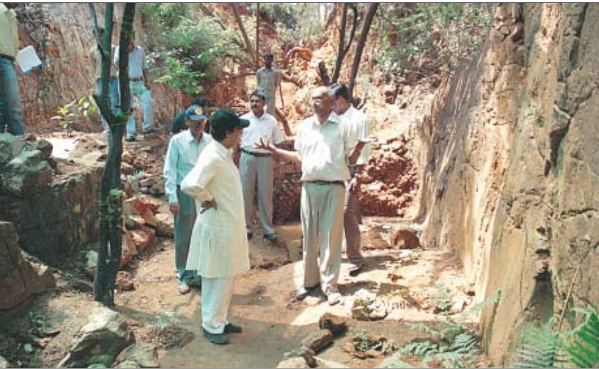
श्री अजय माकन, केन्द्रीय शहरी विकास राज्यमंत्री अरावली जैव वैविध्य पार्क में

सामाजिक-सांस्कृतिक जोन : यह क्षेत्र कार्य-कलापों का केन्द्र है, जिसमें एम्फी थियेटर, जलक्रीड़ा सुविधाएँ एवं सांस्कृतिक आयोजन, प्लाजा की सुविधाएँ हैं जिनके द्वारा सांस्कृतिक भावना को बढ़ावा दिया जा रहा है। इस जोन में जलाशय और पैदल पथों का निर्माण कार्य चल रहा है।