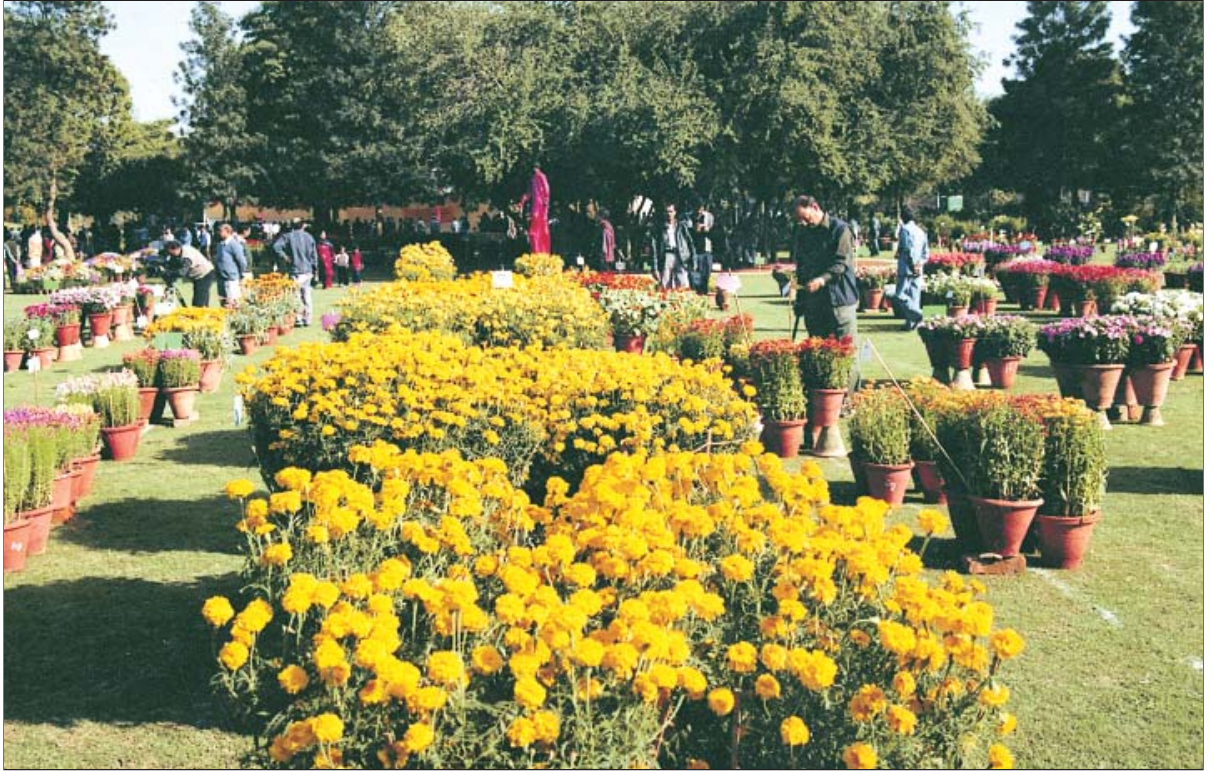
जिला पार्क, हौज खास में पुष्प प्रदर्शनी का एक दृश्य