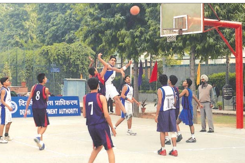
बास्केट बॉल का मैच चल रहा है