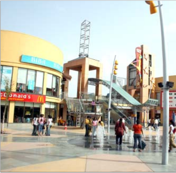
स्वर्ण जयंती पार्क, रोहिणी के समीप मनोरंजन पार्क