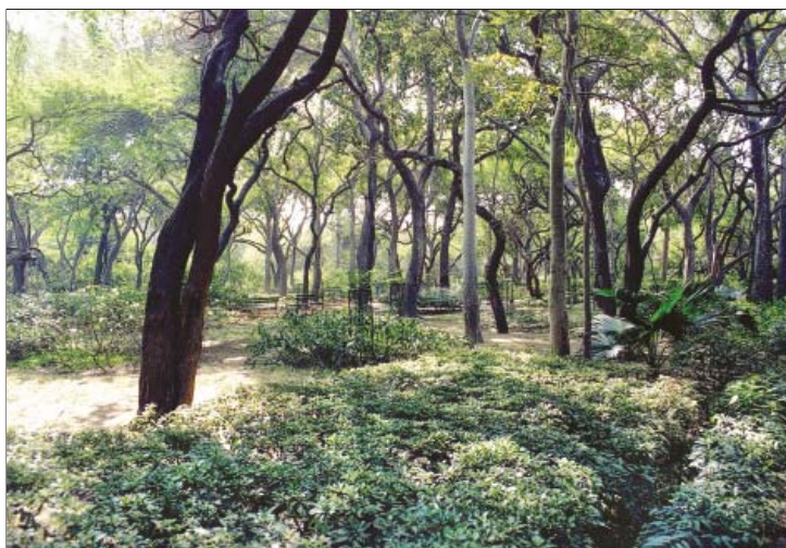
रोहिणी में फलोद्यान