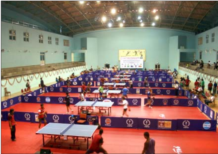
दि.वि.प्रा. के एक खेल-कूद परिसर में अखिल भारतीय अन्तर्संस्थानिक टेबल टेनिस चैंपियनशिप प्रगति पर