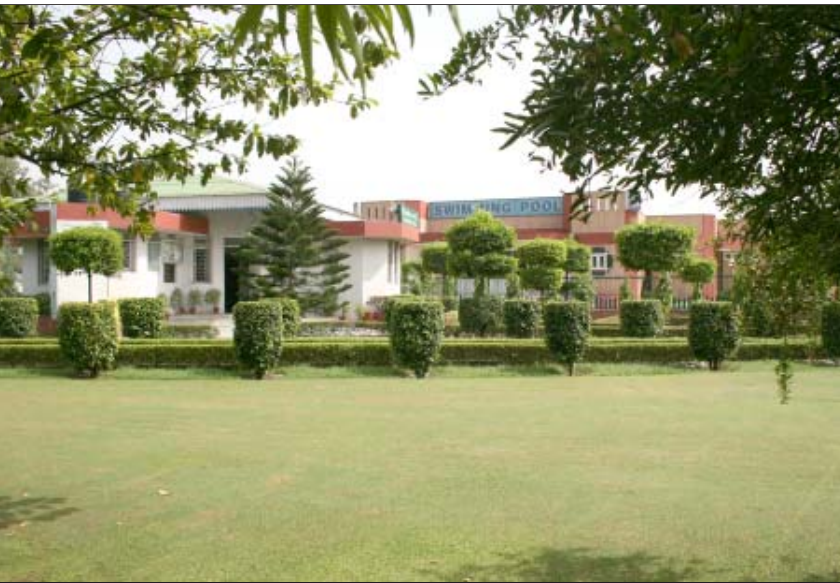
राष्ट्रीय स्वाभिमान खेल परिसर, पीतमपुरा