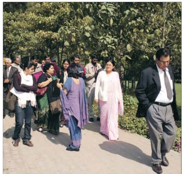
हरित क्षेत्र को देखने आए मीडिया कर्मी

प्रथम भाग बड़ी संख्या में विद्यमान वृक्षों और प्राकृतिक भू आकृति विज्ञान संबंधी विशेषताओं वाला मुख्य क्षेत्र है। इसकी योजना इस मार्ग को सुन्दर बनाने और जिला पार्क के दृश्य-स्तर में सुधार लाने के लिए बनाई गई है। पार्क के अन्दर वृक्षारोपण एवं दूर तक दृश्य दिखाई देने की बात को ध्यान में रखते हुए सोच-समझकर टीलों की व्यवस्था की गई है, ताकि लोगों में