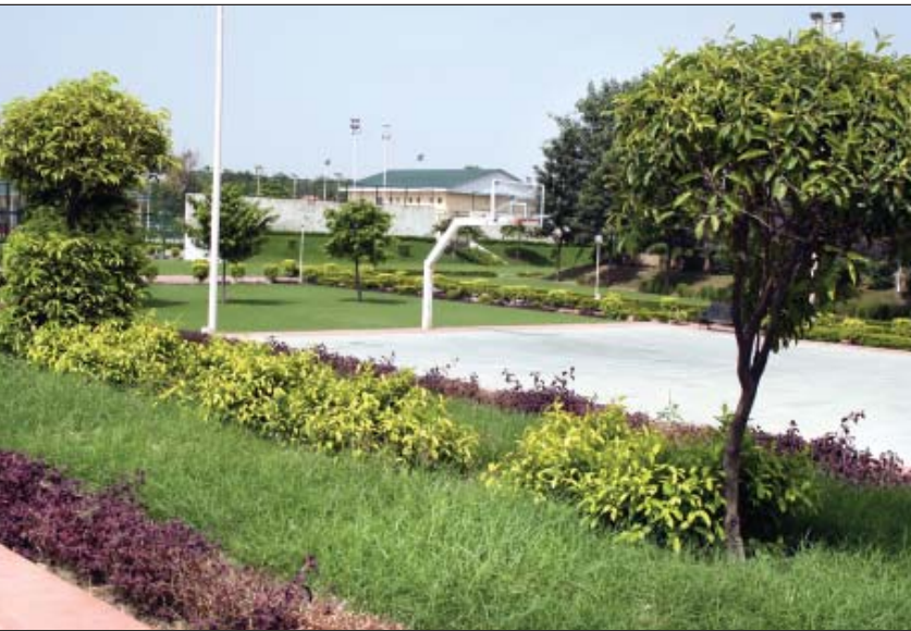
पीतम पुरा में खेल परिसर का एक दृश्य