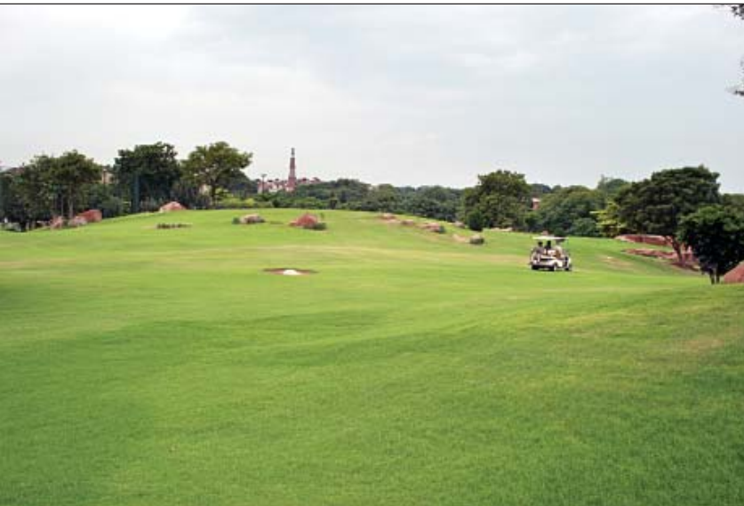
कुतुब गोल्फ कोर्स