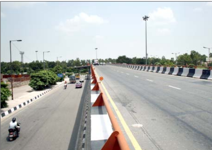
वजीर पुर में प्लाई ओवर

14.3 कोटि नियंत्रण कक्ष, जिसका वर्ष 1982 में थोड़े से कर्मचारियों के साथ गठन किया गया था, जो अब 8 कनिष्ठ अभियन्ताओं, 9 सहायक अभियन्ताओं, (7 सिविल और 2 विद्युत) 7 अधीशासी अभियन्ताओं (6 सिविल और 1 विद्युत), एक सहायक निदेशक (उद्यान) और एक अधीक्षण अभियन्ता, मुख्य अभियन्ता (कोटि नियंत्रण) प्रमुख के साथ अपनी पूरी शक्ति सहित अब बढ़ गया है।