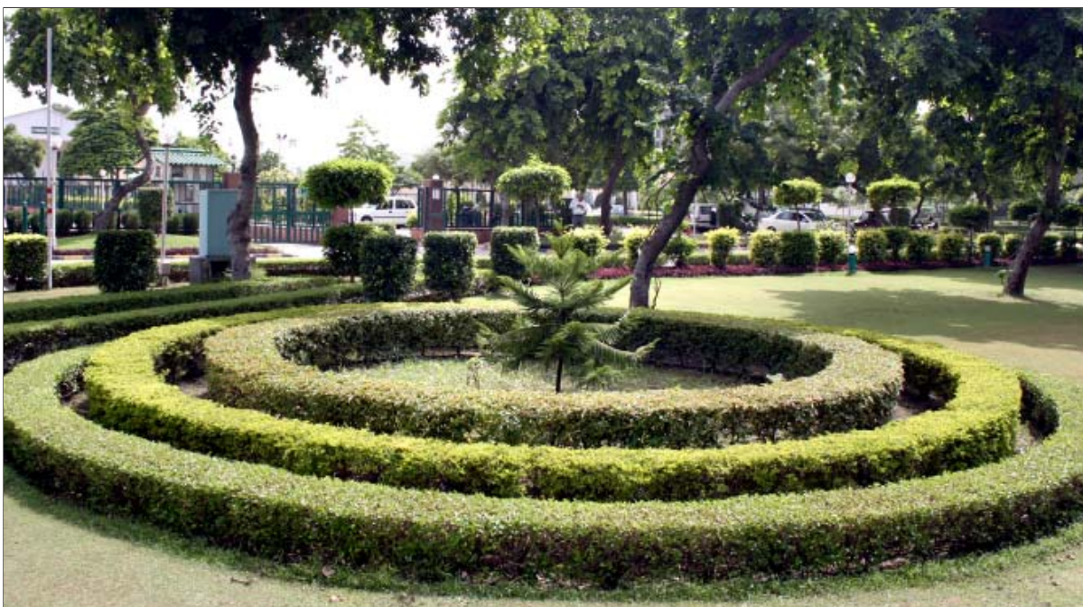
दि.वि.प्रा. द्वारा विकसित क्षेत्रों में से एक