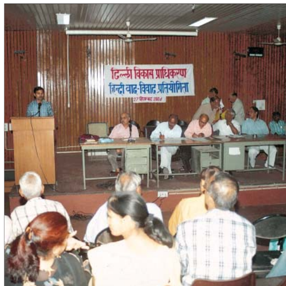
विकास सदन में हिन्दी पखवाड़ा

हिन्दी विभाग द्वारा भारत सरकार की राजभाषा नीति के कार्यान्वयन को अधिक प्रभावशाली बनाने के लिए 62 निरीक्षण किए गए। इस अवधि के दौरान प्राधिकरण की राजभाषा कार्यान्वयन समिति की 2 बैठकें भी आयोजित की गईं। कर्मचारियों को हिन्दी में नोटिंग-ड्राफ्टिंग का प्रशिक्षण देने के लिए 5 हिन्दी कार्यशालाएं आयोजित की गईं, जिनमें 121 कर्मचारियों को प्रशिक्षण दिया गया।