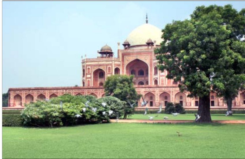
हुमायूँ का मकबरा

12 वीं शताब्दी में मुहम्मद गौरी ने इस शहर पर आक्रमण किया, जिसमें पृथ्वी राज चौहान परास्त हुआ था, परन्तु गौरी अपना शासन नहीं चला सका। उसने नई राजधानी को अलाउद्दीन खिलजी के हाथों में सौंप दिया, जिसने लाल कोट को 1303 तक अपनी राजधानी के रूप में रखा।