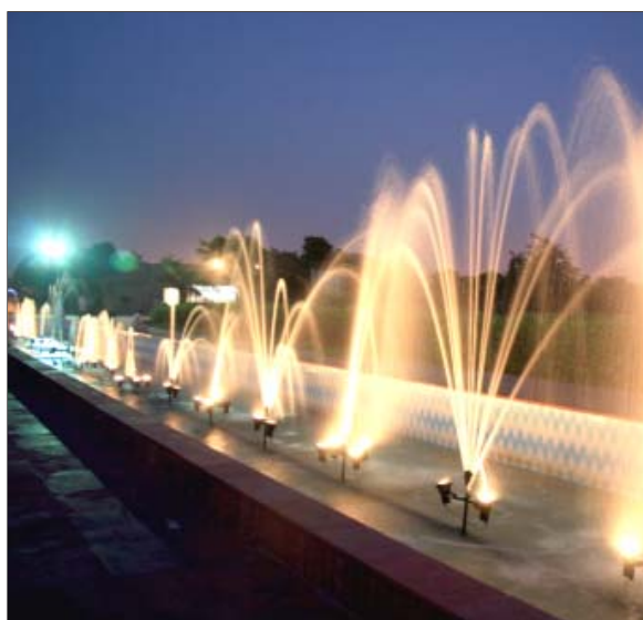
स्वर्ण जयन्ती पार्क, रोहिणी में प्रदीप्त फव्वारा

स्वर्ण जयन्ती पार्क के ठीक निकट 25 हैक्टे. भूमि के एक टुकड़े को नियोजित किया गया है और अंतरराष्ट्रीय स्तर के एक मनोरंजन पार्क के रूप में विकसित करने के लिए मैसर्स यूनीटेक