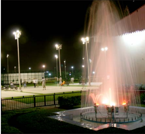
रोहिणी खेल परिसर

एवं उन्हें बनाए रखने के रूप में आरम्भ किया है। कुल मिलाकर 11 स्थलों को पहले ही अनुमोदित/विकसित किया जा चुका है और विभिन्न जनों में 16 स्थलों के भू-दृश्यांकन प्लान विकास कार्य के लिए अनुमोदित किये जा चुके हैं।