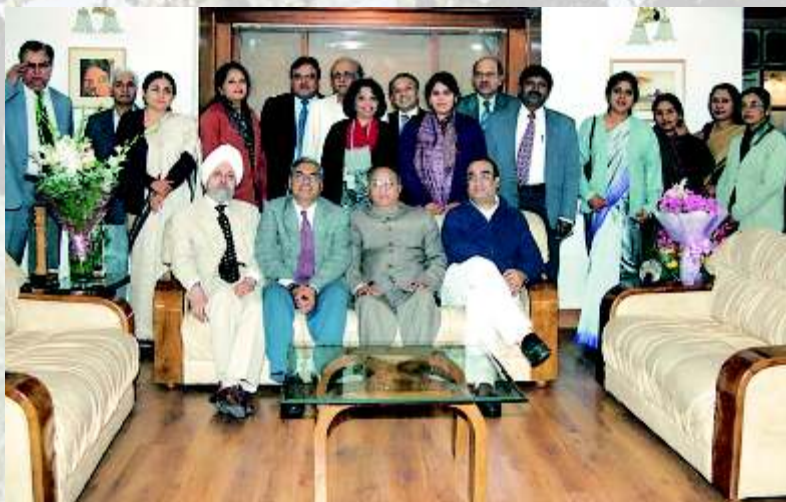
श्री ए. स. ज. यपालर 'डडीक'ेन्द्रीयर हररी विकासमं त्री, श्री अ. जयम।कन, क'ेन्द्रीयर हररी विकासर।ज्यमं त्री दि.मु.यो. 2021द लक'ेस।थ