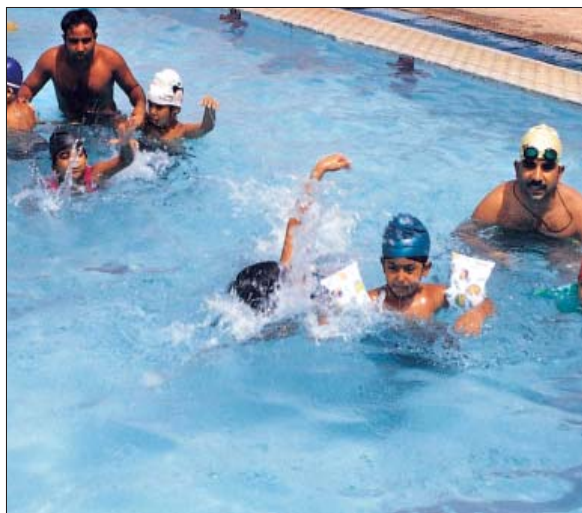
द्वारका खेल परिसर का तरण ताल