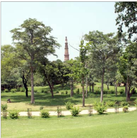
कुतुब मीनार के आस-पास हरित क्षेत्र

दिल्ली का नामकरण विद्यमान कुतुबमीनार के निकट एक शताब्दी ईसा पूर्व बने हुए शहर पर किया गया है। उस शहर को लाल कोट के नाम से पुकारते थे। यह नाम तोमर सल्तनत के राजा अनंगपाल ने दिया था। लाल कोट बाद में किला राय पिथौरा में बदल गया, जो पृथ्वीराज चौहान के नाम पर रखा गया।