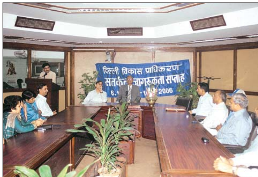
उपाध्यक्ष, दि.वि.प्रा. सतर्कता जागरूकता सप्ताह के दौरान वरिष्ठ अधिकारियों को सम्बोधित करते हुए

दि.वि.प्रा. ने 06-11-2006 से 10-11-2006 तक मनाये गये सतर्कता जागरूकता सप्ताह के दौरान भूमि निपटान विभाग द्वारा रोहिणी आवासीय योजना के आर्बिट्रियों के लाभ के लिए रोहिणी में एक लोक शिविर का आयोजन किया गया। इस लोक शिविर में 163 हस्तांतरण विलेख निष्पादित किए गए, 115 मामलों में हस्तांतरण विलेख दस्तावेज जारी किए गए और परिवर्तन के लिए 134 विवरणिकाएं बेची गयीं। दि.वि.प्रा. की समर्पित सेवा करने के लिए दि.वि.प्रा. के 10 कर्मचारियों को पुरस्कार देकर सम्मानित भी किया गया।