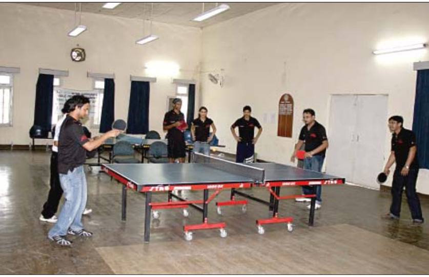
टेबल टेनिस मैच चल रहा है

स्थल सत्यापन तैयार कर रहा है और गिराये जाने वाले ढांचों हेतु ड्राइंगों की तैयारी की जा रही है।