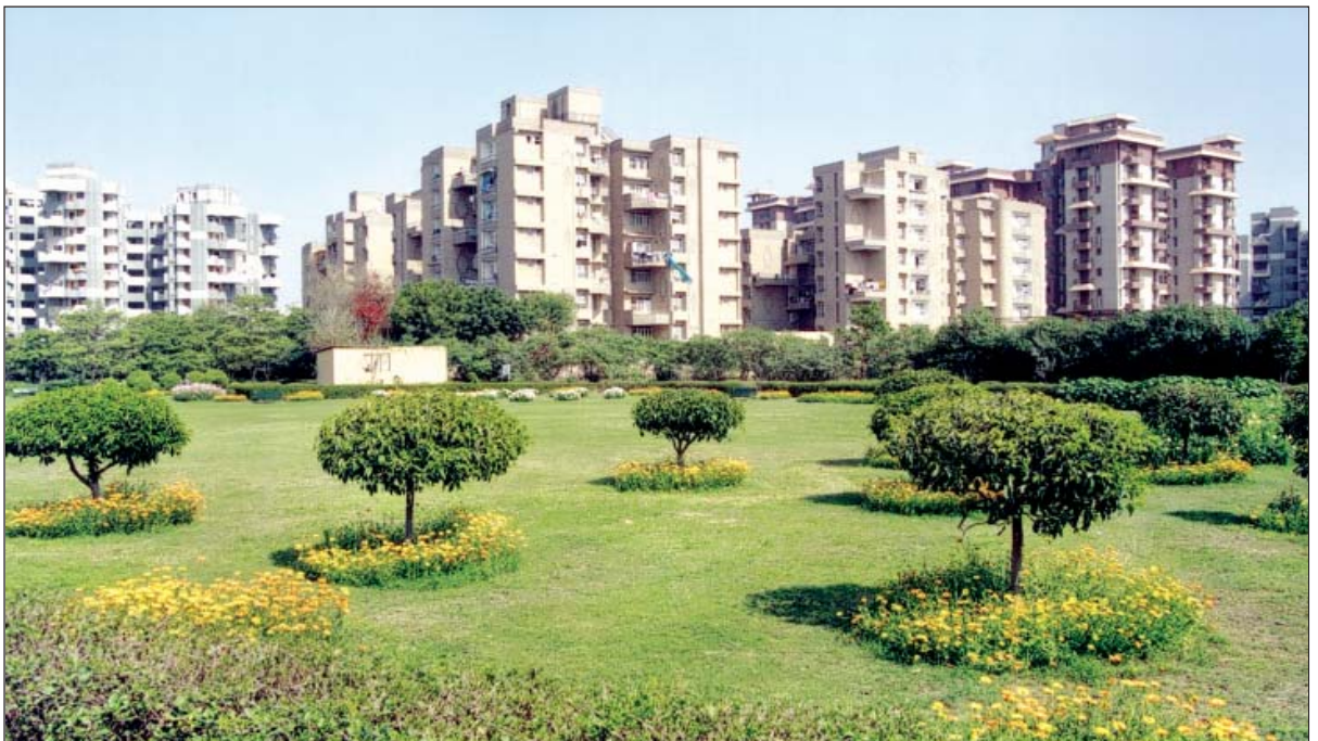
आवासीय परिसर के पास दि.वि.प्रा. द्वारा विकसित किया गया हरित क्षेत्र