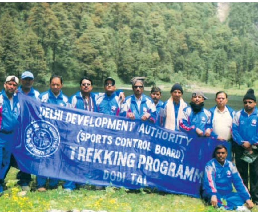
डोडी ताल में दि.वि.प्रा. कर्मचारियों की ट्रेकिंग टीम