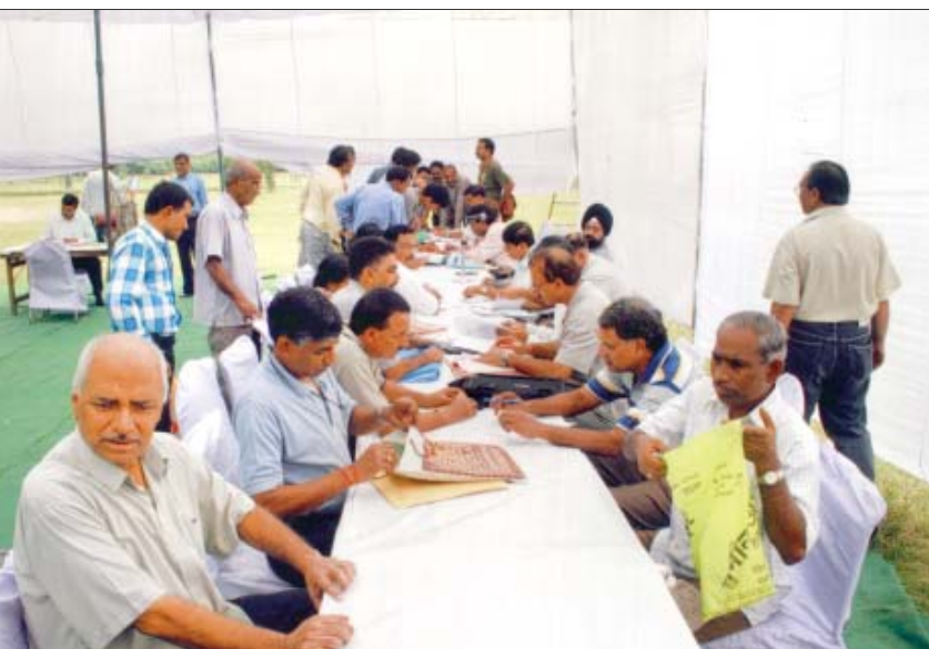
रोहिणी में लोक शिविर

दि.वि.प्रा. की वेबसाइट www.dda.org.in दि.वि.प्रा. के विभिन्न पहलुओं जैसे आवास, भूमि, मुख्य योजना, खेलकूद, पर्यावरण आदि पर जानकारी उपलब्ध कराती है। जनहित की जानकारी जैसे आवास और भूमि निपटान के ड्रा के परिणाम इस वेबसाइट पर उपलब्ध रहते हैं। आम जनता की सुविधा के लिए डाटा बेस से पंजीकरण विवरण, प्राथमिकता की स्थिति और भुगतान का विवरण देखने के लिए फार्म के माध्यम से चौबीस घंटे पूछताछ करने की व्यवस्था कर दी गई है। यह पूछताछ वेबसाइट पर चौबीस