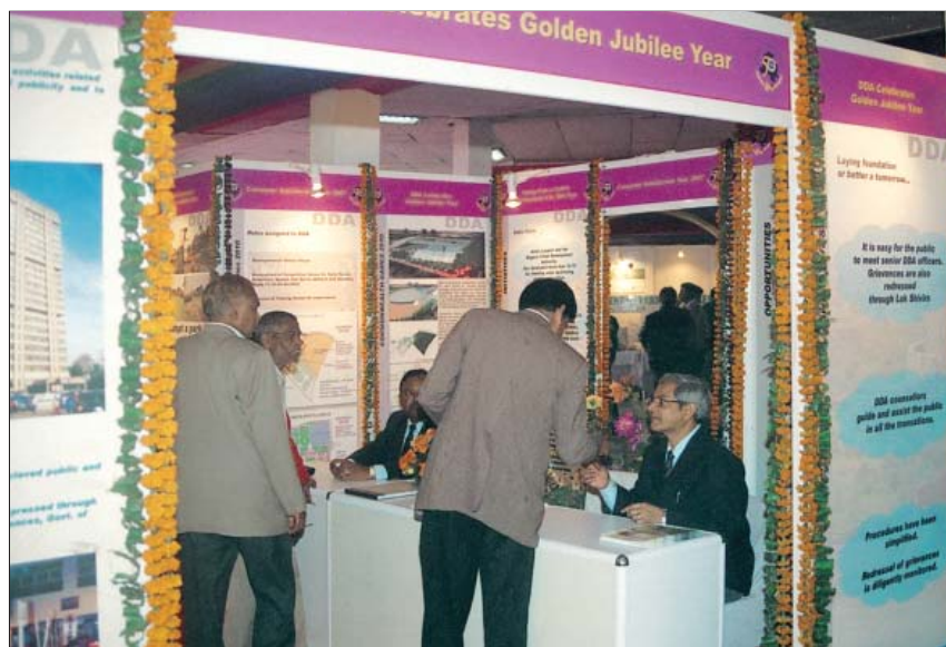
प्रगति मैदान में भागीदारी मेले में दि.वि.प्रा. का स्टॉल

दिनांक 30.6.2007 तक 3,335 में से लगभग 3000 कब्जा-पत्र जारी कर दिए गए हैं। (फ्लैट नरेला, द्वारका, रोहिणी और बिन्दापुर में आबंटित किए गए हैं।)