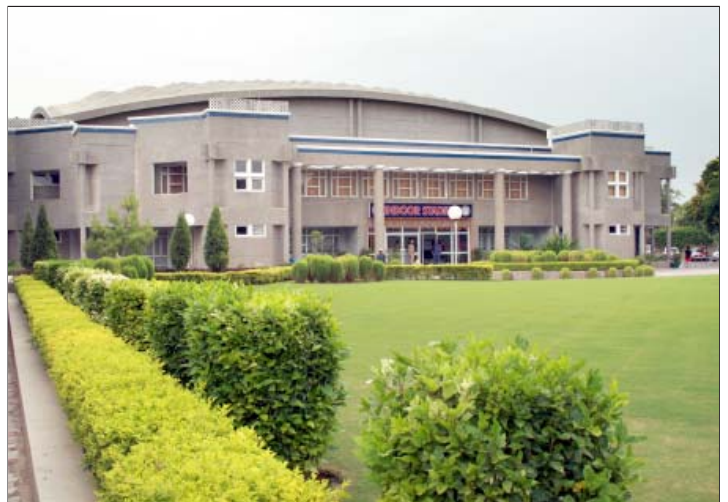
सीरीफोर्ट खेल परिसर में इन्दोर स्टेडियम