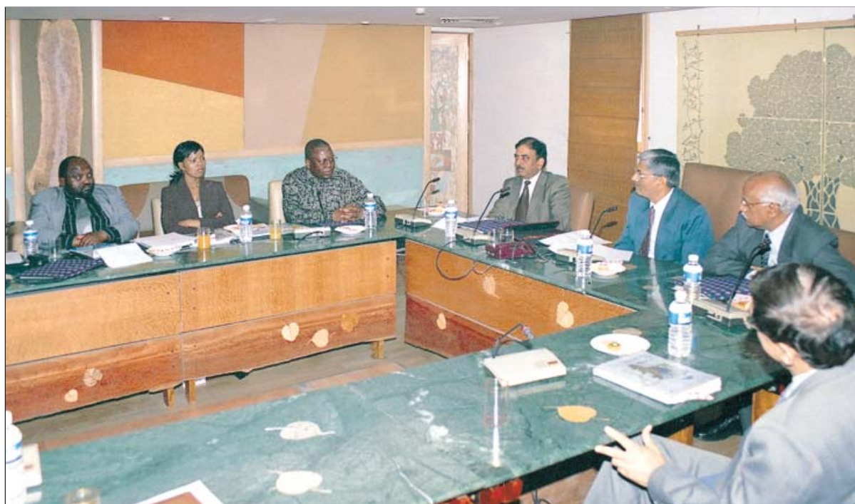
उपाध्यक्ष, दि.वि.प्रा. विकास सदन में आयोजित बैठक में दक्षिण अफ्रीकी प्रतिनिधिमण्डल के साथ