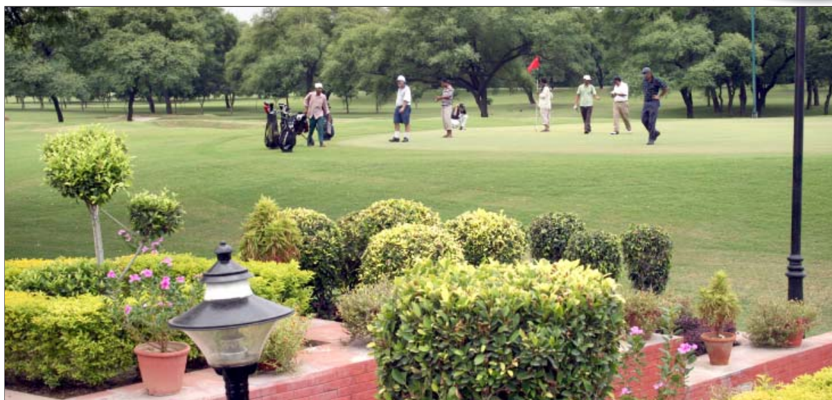
कुतुब गोल्फ कोर्स में गोल्फ का आनन्द लेते हुए गोल्फ खिलाड़ी

13.1 कंकरीट जंगल में सदा हरा-भरा रहने वाला वन मिलना आश्चर्य की बात है। इसी सत्यता के कारण दि.वि. प्रा. को देश में श्रेष्ठ हरित क्षेत्रों के जाल की व्यवस्था करने के लिए अपने ऊपर गर्व है। इस बात का श्रेय नगर वनों के विकास, वन क्षेत्र, हरित पट्टियों, गोल्फ कोर्स, खेल परिसर, सहस्राब्दी पार्क और आवासीय कालोनियों, व्यावसायिक, औद्योगिक क्षेत्रों तथा विरासत स्मारकों के आस-पास बने हुए लघु भूखण्डों के कारण मिला है।