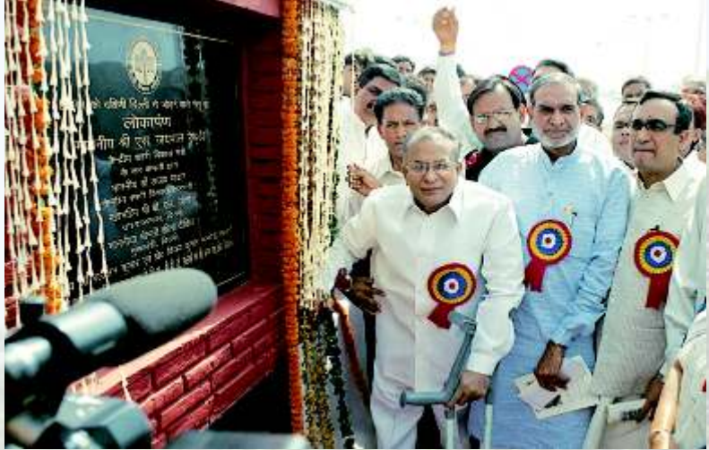
श्री ए. स. ज. यपालर 'डडी, क 'न्द्रीयर 'हरीर विकास मंत्री, द्व 'रकाम 'फ लाईअ 'वरक । उद्घाटनक रतेहु, ए