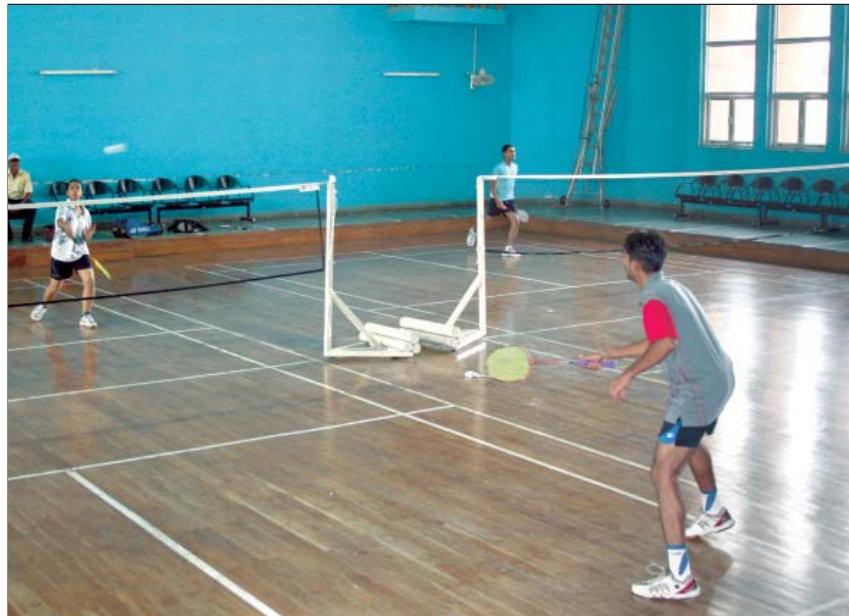
सीरीफोर्ट खेल परिसर में बैडमिंटन का अभ्यास

वादी ने दि.वि.प्रा. को उसके अतिरिक्त किसी को भी जिला केन्द्र जनकपुरी में पार्किंग स्थल का आबंटन करने से रोकने के लिए आदेश पाने के लिए व्यादेश हेतु एक मुकदमा दायर किया है। वादी ने आरोप लगाया कि उसने अपनी निविदा जो 31.07.06 को समाप्त हो गई है, के नवीकरण के लिए सुरक्षित जमा राशि के रूप में 23 लाख रु. जमा कराए थे। तथापि, वादी की निविदा को दि.वि.प्रा. ने इस आधार पर अस्वीकार कर दिया कि दि.वि.प्रा. ने उससे उच्च बोली प्राप्त कर ली है। दि.वि.प्रा. ने यह बताते हुए मुकदमे का बचाव किया कि वादी की निविदा 30.6.06 को समाप्त हो गई थी और उसकी बढ़ाई गई समयावधि भी 31.07.06 को समाप्त हो गई थी। इसलिए, दि.वि.प्रा. ने 1.8.06 को