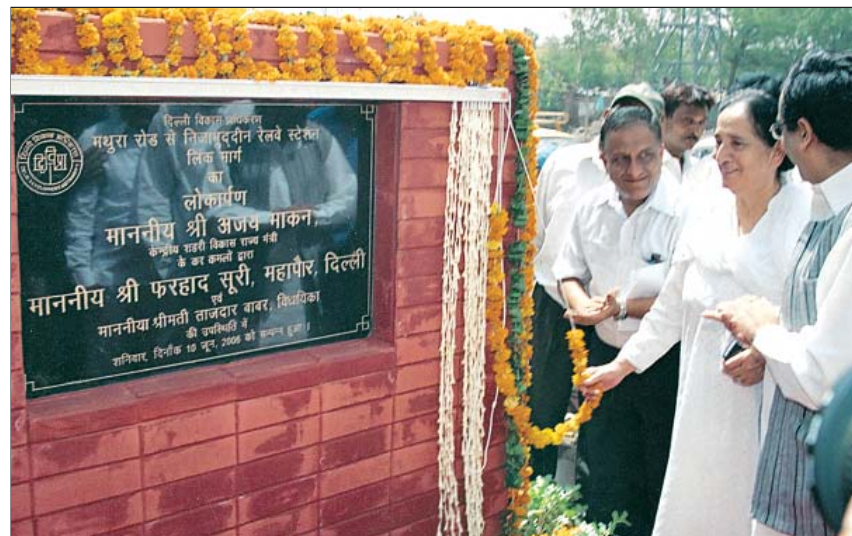
श्री अजय माकन, शहरी विकास राज्य मंत्री मथुरा रोड और निजामुद्दीन रेलवे स्टेशन के बीच लिंक रोड को दिल्लीवासियों को समर्पित करते हुए