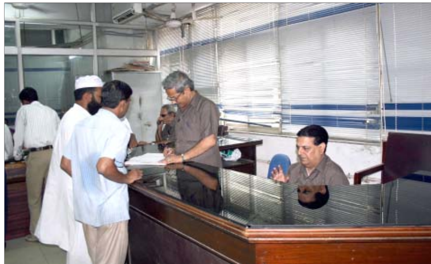
विकास सदन स्थित स्वागत काउन्टर पर आगंतुकों की सहायता करते हुए दि.वि.प्रा. कर्मचारी

15 हैक्टेयर क्षेत्रफल में फैला सतपुला झील परिसर इस तरह तैयार किया गया है ताकि हर तरह की मनोरंजनात्मक सुविधाओं को क्रियान्वित किया जा सके। इस स्थल पर तीन तरफ से