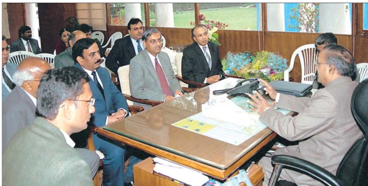
श्री एस. जयपाल रेड्डी, शहरी विकास मंत्री के साथ दि.वि.प्रा. के उपाध्यक्ष और वरिष्ठ अधिकारीगण