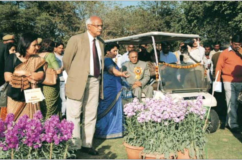
श्री एस. जयपाल रेड्डी, केन्द्रीय शहरी विकास मंत्री हौजखास जिला पार्क में आयोजित पुष्प प्रदर्शनी में