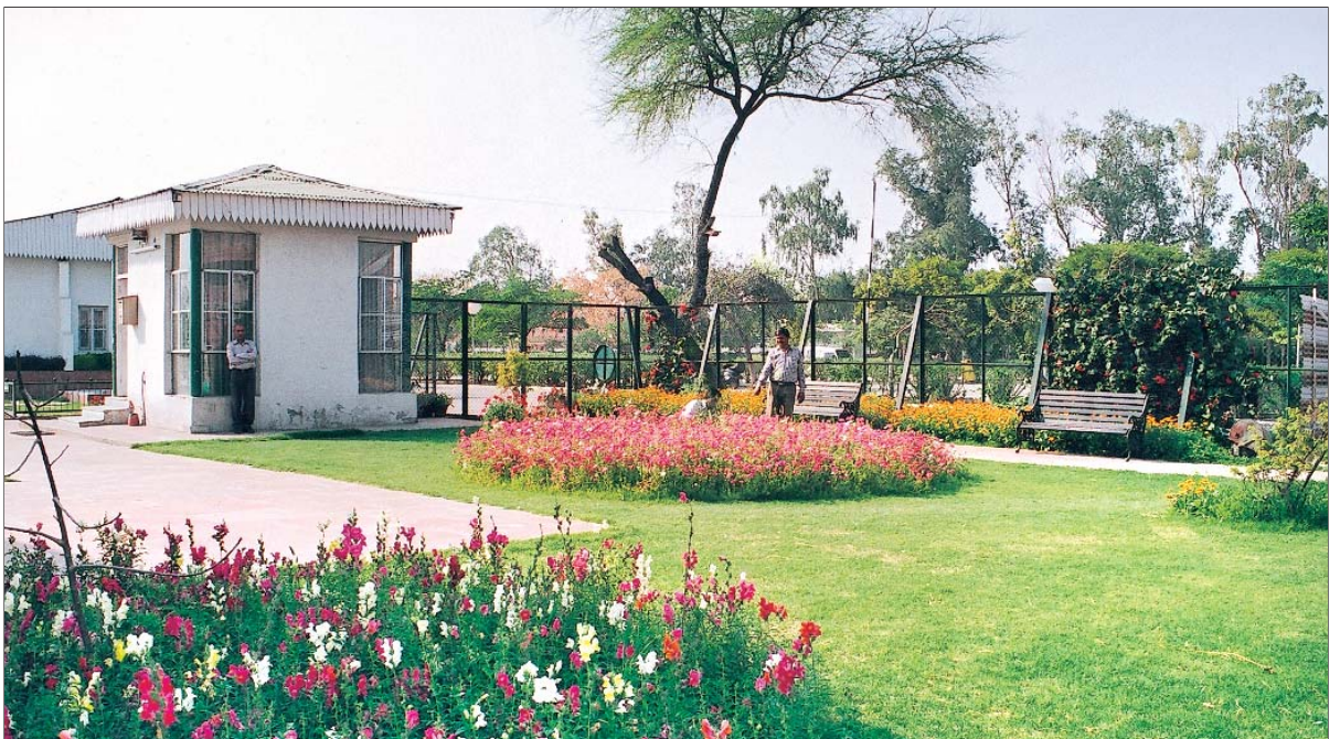
दि.वि.प्रा. द्वारा विकसित और रख-रखाव किया गया एक परिसर

जैव-वैविध्य पार्क यमुना नदी घाटी में जैव-विविधता की प्रचुरता और इसकी विरासत को बनाए रखते हुए शहरी जनता के पारिस्थितिकीय, सांस्कृतिक और शैक्षिक ज्ञान में वृद्धि करता है। इस पार्क का विकास विभिन्न चरणों में किया जाएगा और इसके 10 वर्षों में विकसित होने की संभावना है। फिलहाल दि.वि.प्रा. फेज-I में 157 एकड़ भूमि पर जैव विविधता पार्क विकसित कर रहा है। अन्य 300 एकड़ भूमि दूसरे फेज में शामिल की जाएगी।