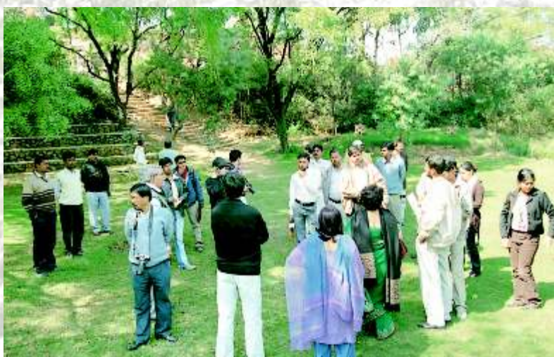
जैववैविध्यप।कर्म'र।मणक रतेहु, एम।डियाक मी