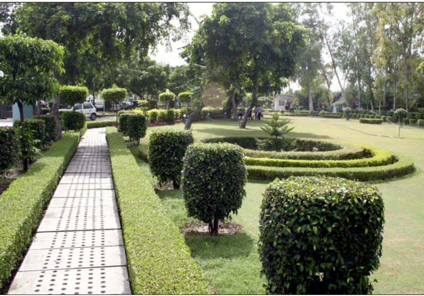
जिला पार्क, पीतमपुरा

सितम्बर, 2006 में हिन्दी पखवाड़ा मनाया गया। इस पखवाड़े के दौरान हिन्दी आशुलिपि, हिन्दी टंकण, हिन्दी नोटिंग-ट्राफ़्टिंग तथा हिन्दी वाद-विवाद प्रतियोगिताओं का आयोजन किया गया। इन प्रतियोगिताओं में विजेता 27 अधिकारियों एवं कर्मचारियों को कुल 31600/- ₹. के नकद पुरस्कार दिए गए। प्राधिकरण में लागू तिमाही नकद पुरस्कार योजना के अंतर्गत 6 अधिकारियों एवं 9 कर्मचारियों को कुल 18300/- ₹. के नकद पुरस्कार दिए गए। प्राधिकरण के अधिकारियों/ कर्मचारियों के बच्चों के लिए दिनांक 29.12.2006 को एक भाषण-प्रतियोगिता का आयोजन किया गया, जिसमें कक्षा 1 से 8 व कक्षा 9 से 12 वर्ग तक के 30 बच्चों को कुल 7800/- ₹. के नकद पुरस्कार व अन्य उपहार दिए गए।