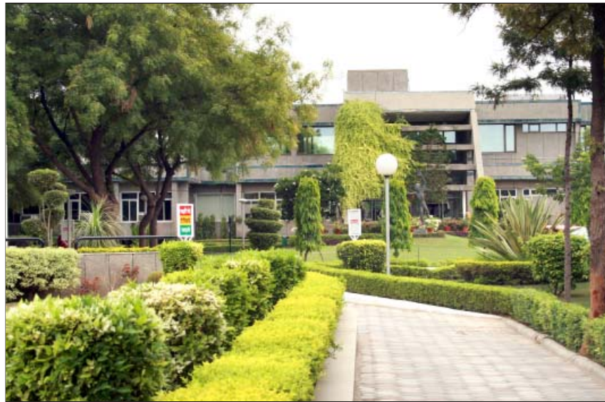
सीरी फोर्ट खेल परिसर