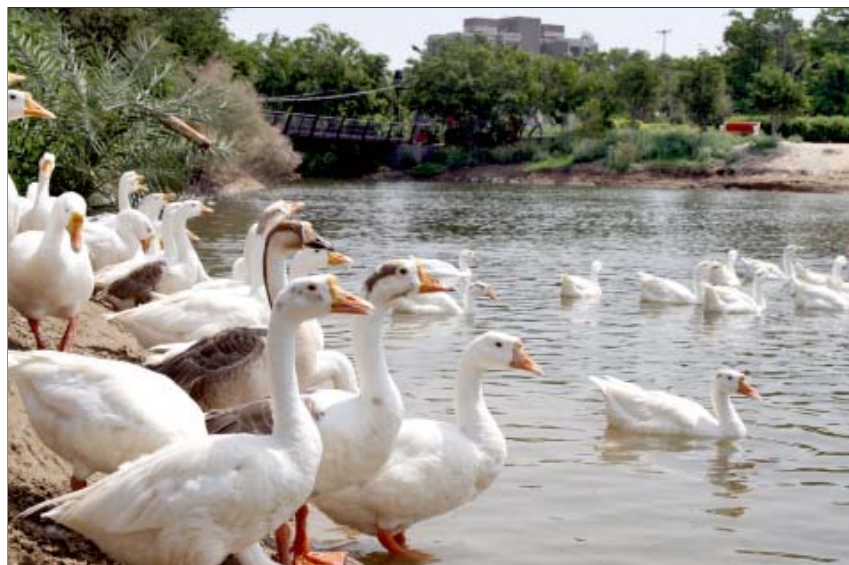
स्वर्ण जयंती पार्क स्थित झील

यह एक पुरानी भूदृश्यांकन परियोजना है जो 140 एकड़ भूमि पर विकसित की गई थी जिसमें 25 एकड़ झील क्षेत्र शामिल है। यह क्षेत्र नीतिबद्ध रूप से राष्ट्रीय राजमार्ग-24 के