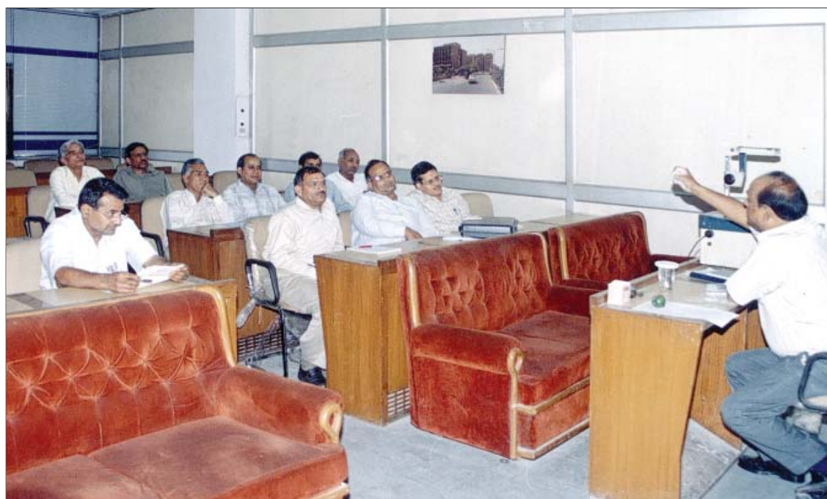
विकास सदन में कम्प्यूटर प्रशिक्षण कक्षा

“आवास” हाउसिंग मैनेजमेंट और एकाउंटिंग पैकेज