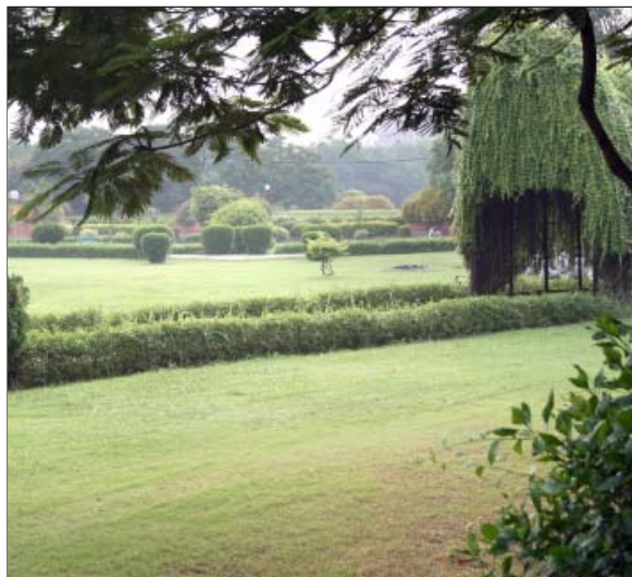
चित्रगुप्त पार्क, रोहिणी

वर्ष 2003-04, 2004-2005, 2005, 2005-06 और 2006-2007 की मुख्य उपलब्धियां निम्नानुसार हैं।