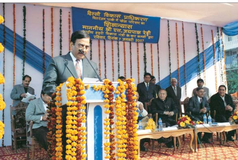
चितरंजन पार्क में खेल परिसर की आधार शिला रखते हुए वित्त सदस्य, दि.वि.प्रा., उच्चाधिकारियों का स्वागत करते हुए