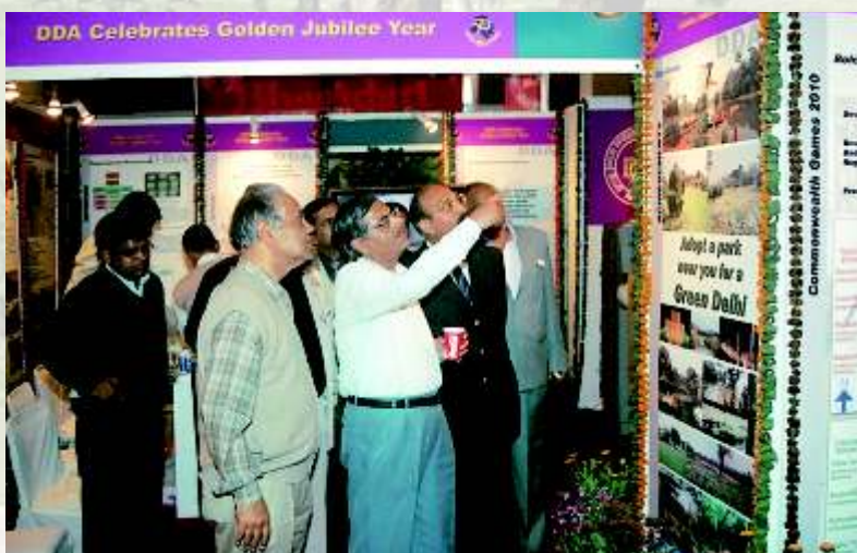
भागीदारीमे।लाप्र गतिमे।दानमे दि.वि.प्रा.क'ेस टॉलक।निरीक्षणक रतेहु, ए दि.वि.प्रा.क'ेस पाध्यक्ष