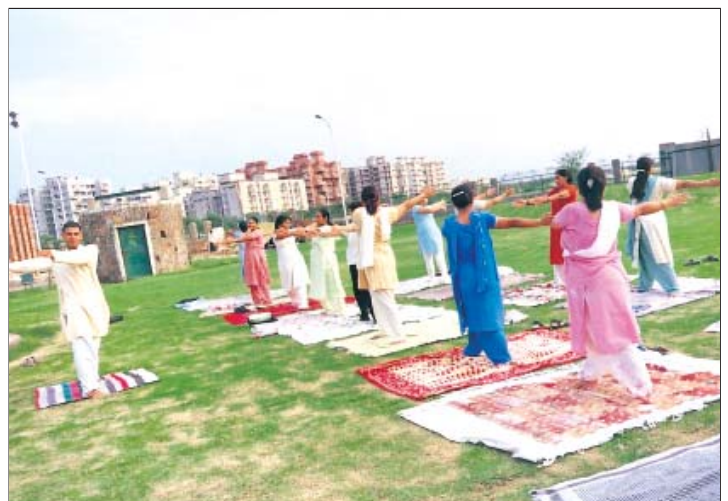
जिला पार्क द्वारका में योग का अभ्यास करते हुए

VII) फ्लैग शिप एस.एफ.एस.सी: दि.वि.प्रा के एस.एफ. एस.सी. का प्रथम खेल-कूद कम्पलैक्स था, जिसका दिनांक 29 मार्च, 1989 को उद्घाटन हुआ और यह स्पोर्ट्स विंग का फ्लैग शिप है। अब दिल्ली में यह